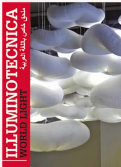
Speciale Russia, Europa dell'Est Edizione in italiano/inglese/cirillico

4 numeri dedicati alle principali aree geografiche nel Mondo