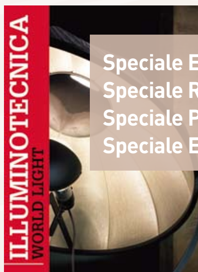
Speciale Estremo Oriente Edizione in italiano/inglese

Speciale Europa Speciale Russia e Paesi dell'Est Speciale Paesi Arabi Speciale Estremo Oriente