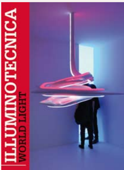
Speciale Europa Edizione in italiano/inglese